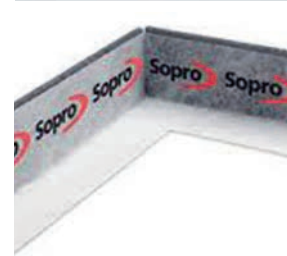
Randdämmstreifen RDS 960