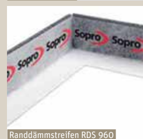
Randdämmstreifen RDS 960