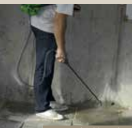
Moos- und Schimmel-Ex