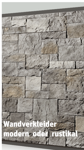
Wandverkleider modern oder rustikal