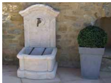
BRUNNEN UND WASSERSTEINE