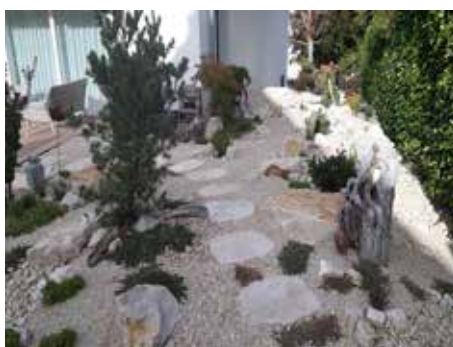
KIES, SCHOTTER, FINDLINGS