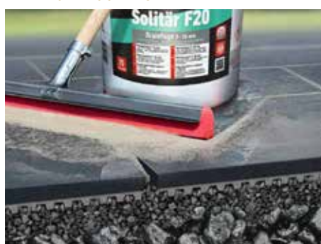
KLEBE- UND FUGENMÖRTEL